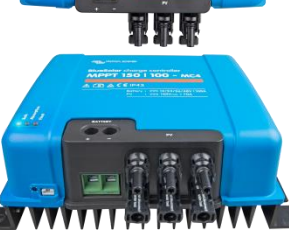
Controlador de carga solar MPPT 150/100-MC4